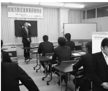
運営側の視点の講義