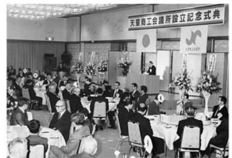
設立記念式典 20年前……