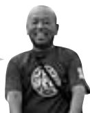
大泉鍋合戦 大会本部長