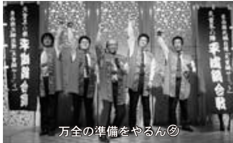
万全の準備をやるん

今回は出店者のブロック分け抽選会を行い、より公平性を高めイベントを盛り上げていきたいと考えました。また、これまで同様、地球環境を考えて器のリサイクルに取り組みむとともに、マイ箸持参を呼びかけます。今年の鍋合戦にぜひ、足を運んでください。