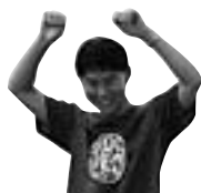
蜂谷鍋合戦 委員長