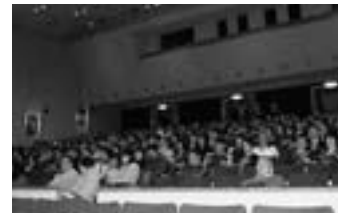
感動につつまれた映画鑑賞会

来場者の中には涙ぐむ姿も見られ、人間として真っ直ぐな気持ちになれる映画上映会となりました。