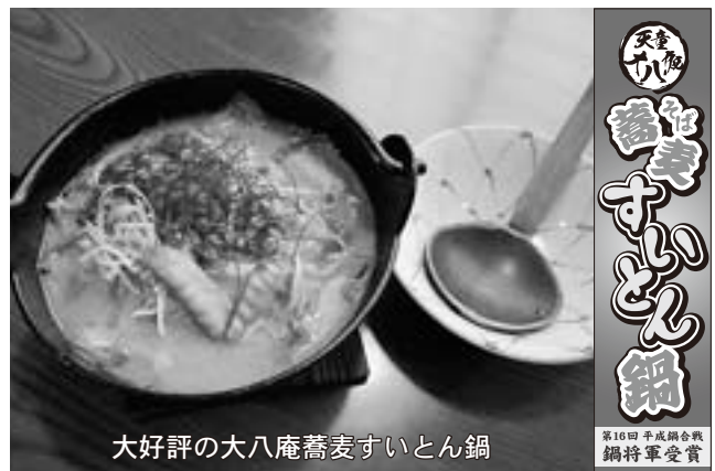
大好評の大八庵蕎麦すいとん鍋

特に相馬市は過去に何度も出店いただき、鍋将軍を受賞された縁で、五月二十四日青年部で支援活動に伺ったさいは「鍋合戦に出ることが目標です」と語っていました。この出店を青年部会員一同嬉しく思っています。復興に向けて頑張っているところを青年部としてPRしていきます。