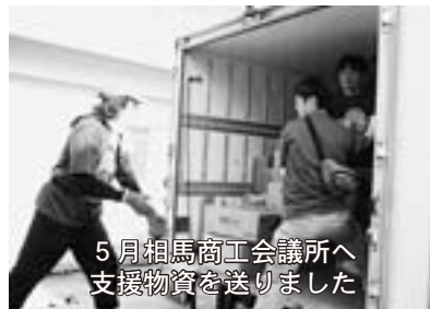
5月相馬商工会議所へ支援物資を送りました

特に相馬市は過去に何度も出店いただき、鍋将軍を受賞された縁で、五月二十四日青年部で支援活動に伺ったさいは「鍋合戦に出ることが目標です」と語っていました。この出店を青年部会員一同嬉しく思っています。復興に向けて頑張っているところを青年部としてPRしていきます。