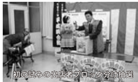
初の試みの出店者ブロック分け抽選