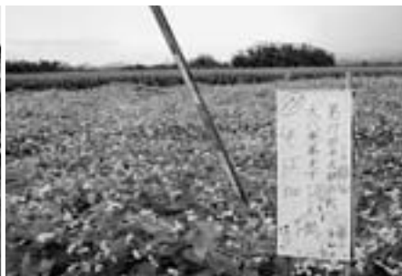
みんなで育てた蕎麦畑

今回二連覇を果たすべく、主材料である蕎麦を青年部会員自ら栽培し育てた蕎麦で臨みます。ぜひ当日は、青年部手づくりの、パーションアップした「蕎麦すいとん鍋」をご賞味下さい。