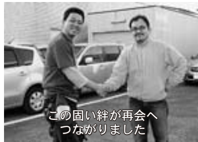
この固い絆が再会へつながりました