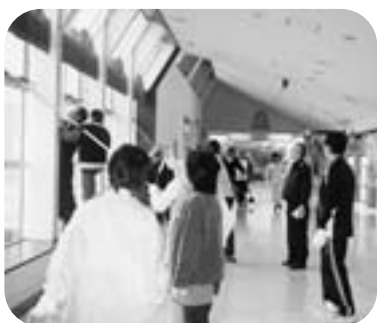
景色が一変したよ。窓拭き

実施日 10月1日 水曜日 午前8時より 実施場所 JR天童駅周辺 内 容 駅東口広場・駐輪場清掃 工業部会・商業部会 駅西口広場・駐輪場・花壇清掃 建設業部会・金融部会 自由通路・階段・エレベータホール 観光・交通運輸・サービス業部会 協力団体 パルテナント共栄会 グリーンモール天童商店街 ニューてんどう商店街