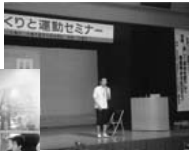
◀ 自分の体力年齢は何歳かな？