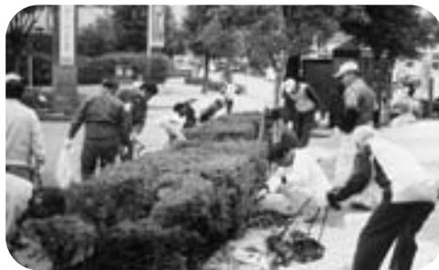
見違えた駅前広場に感激