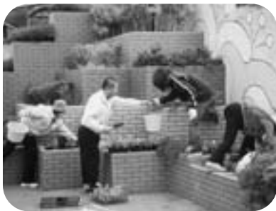
西口花壇のパンジーも見てね