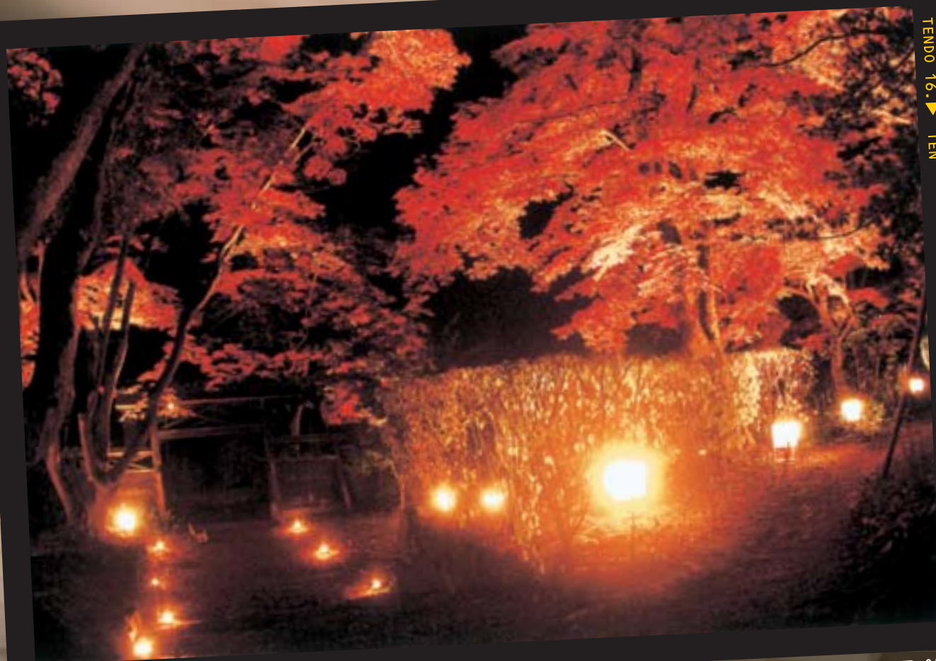
格知学舎のライトアップ

The Tendo Chamber of Commerce and Industry VOL.191 NOV 11月