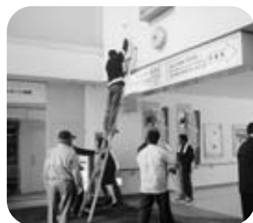
案内板もきれいになりました

実施日 10月1日 水曜日 午前8時より 実施場所 JR天童駅周辺 内 容 駅東口広場・駐輪場清掃 工業部会・商業部会 駅西口広場・駐輪場・花壇清掃 建設業部会・金融部会 自由通路・階段・エレベータホール 観光・交通運輸・サービス業部会 協力団体 パルテナント共栄会 グリーンモール天童商店街 ニューてんどう商店街