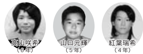
— 団体総合競技に参加した3名 —