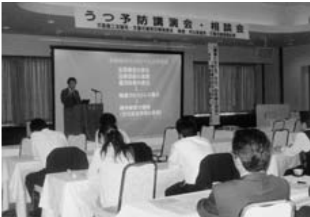
実技を交えたセミナー