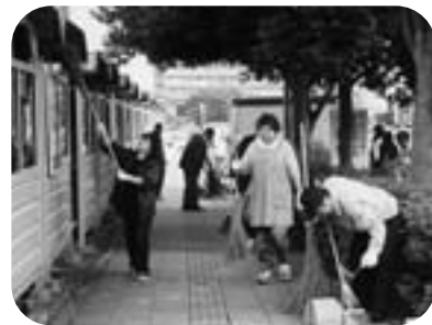
きれいに使いましょう。駐輪場