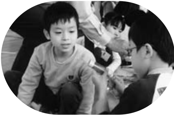
うまく巻けるかな? コイル巻き