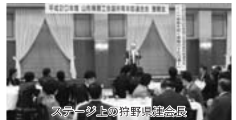
ステージ上の狩野県連会長