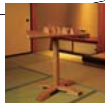
テーブル型将棋盤 ROKU ROKU