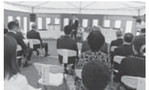
9月11日 天童温泉屋台村「と横丁」新築工事 地鎮祭 屋台村は2020年1月オープン予定