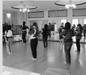
▲赤ちゃんと一緒に楽しく踊ろう