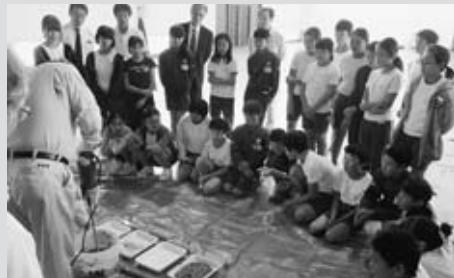
模擬泥土を用いた実験

10月2日(火)建設業部会は、山口小学校で日本技術士会東北本部山形県支部と共催で、模型とドローンを用いた出前授業を開催しました。建設産業に興味を持ってもらうこと、防災に対する意識の向上を目的に実施しました。