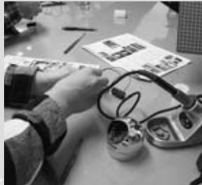
▲創学館高校の生徒が教授になったLEDライトづくり講座