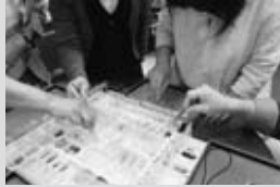
▲自分らしいメガネチェーンを作りましょう