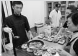
▲旬の魚で美味しいおつまみづくり