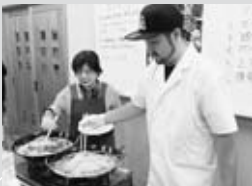
▲三和油脂の油で魚のフライを作りました