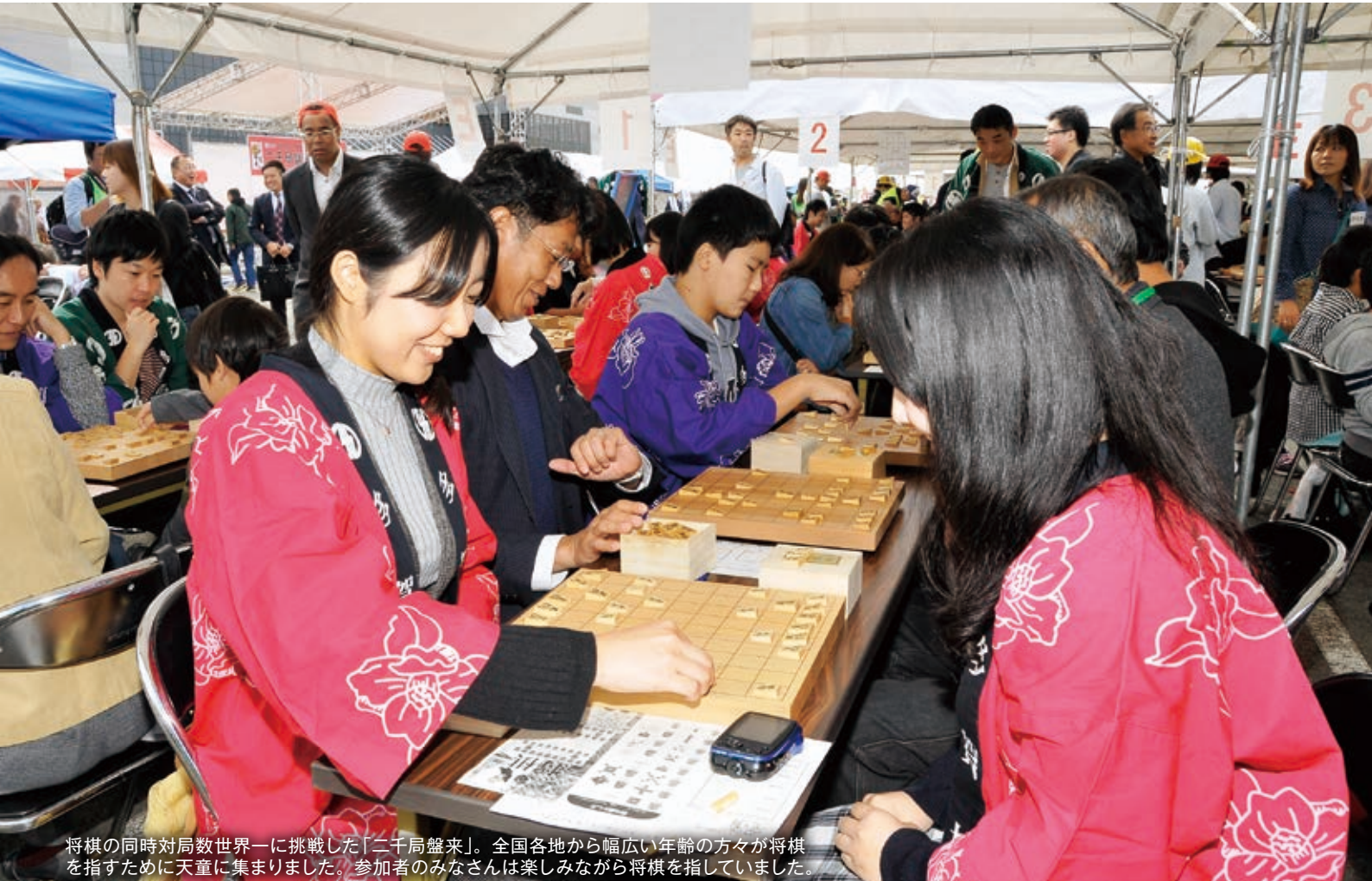
将棋の同時対局数世界一に挑戦した「二千局盤来」。全国各地から幅広い年齢の方々方が将棋を指すために天童に集まりました。参加者のみなさんは楽しみながら将棋を指していました。