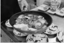
▲なんと、こんなに美味しいおつまみ

夜間講座も開講し、お勤め帰りにも参加しやすくなりました。キッズ講座も充実。大人から子供まで楽しめるまちなか大学。11月12日まで開催しています。