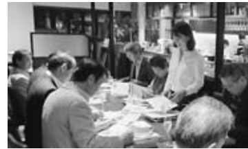
10/24 マロスティカ親善大使報告会