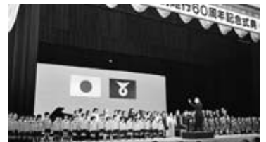
10/1 市制施行60周年記念式典