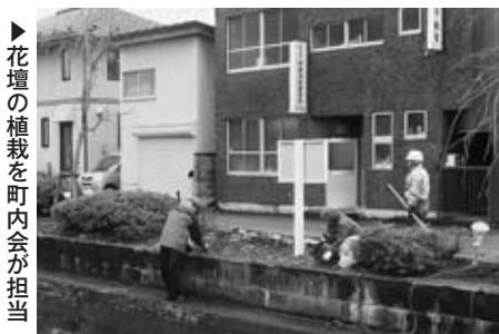
▶花壇の植栽を町内会が担当

建設業部会は4月7日(金)に「地域貢献事業」として倉津川(国道13号線から奥羽本線までの区間)のボランティア清掃活動を実施しました。 建設業部会から66社118名、観光部会から31社67名のほか、市役所や温泉組合をはじめとした観光関係団体、周辺地域の町内会の皆さまからご出席を頂き、総勢220名の参加となりました。