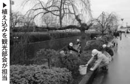
▶植え込みを観光部会が担当