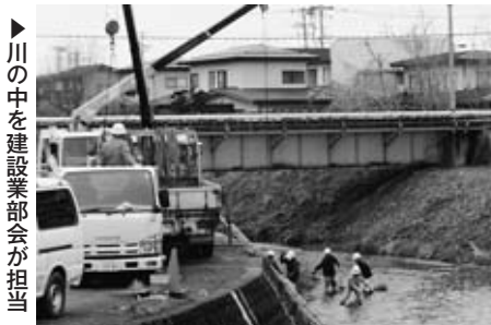
▶川の中を建設業部会が担当