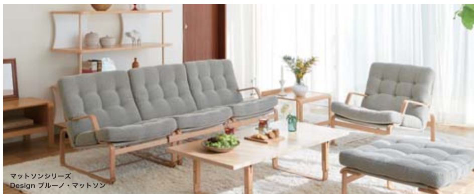
マットソンシリーズ Design ブルーノ・マットソン