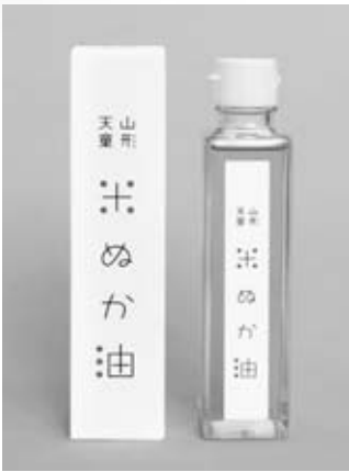
山形天童 米ぬか油