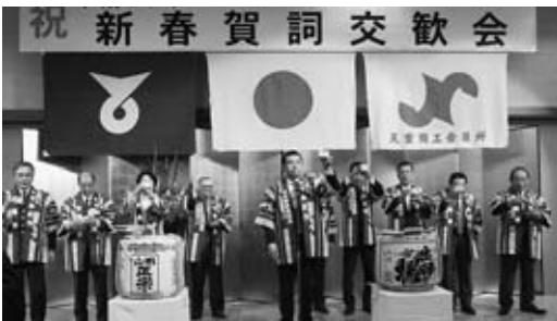
▲新年に「かんばん〜い」