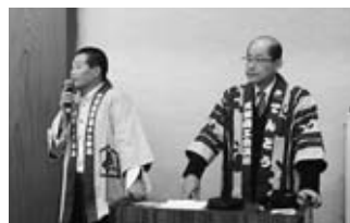
寒中挽き抜きそば賞味会 ほほえみの宿 滝の湯 (天童市)