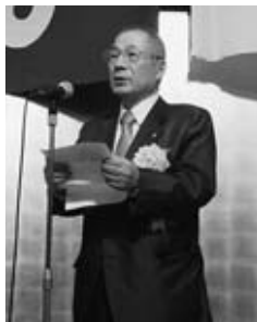
▲挨拶する押野会頭