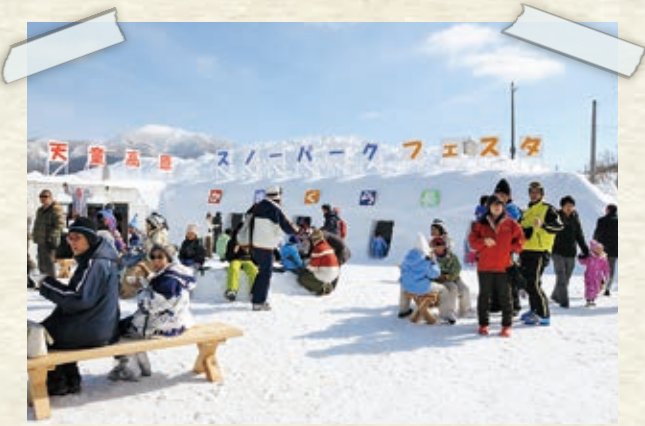
天童高原スノーパークフェスタ