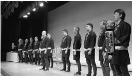
▲幕開けにふさわしい木遣り

賀詞交歓会の開催にあたり、関係団体様より「協賛金」、そして企業様より「協賛品」の提供をいただきました。大変ありがとうございました。