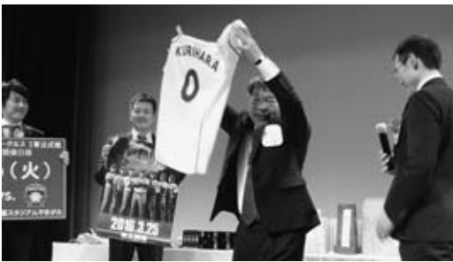
▲抽選会「楽天 栗原選手ユニフォーム」GET

[ダスキン] 清掃用品レンタル、コーヒー 天然水等清潔・衛生・ 環境づくりのプロ