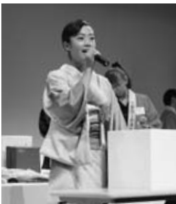
▲応援します！ 女子ゴルフ大和笑莉奈プロ